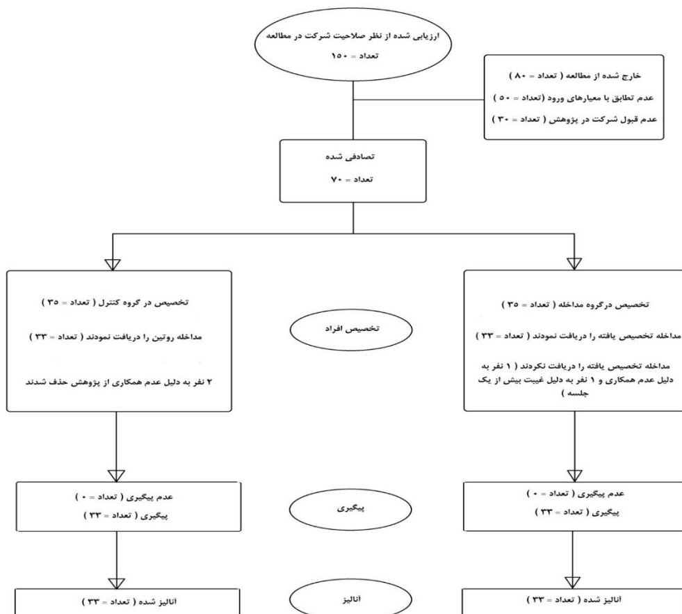
نمودار شماره ۱- نمودار کانسورت مطالعه